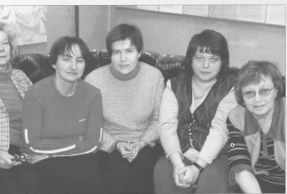
На фото: Преподаватели кафедры детской речи РГПУ им. А.И. Герцена.

Многочисленные плодотворные контакты (совместные конференции по проблемам детской речи, семинары по психолин-