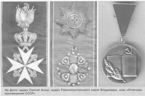
На фото: орден Святой Анны, орден Равноапостольного князя Владимира, знак «Отличник просвещения СССР»

лет домашние наставники могли быть награждены орденом Святой Анны третьей степени, домашние учителя — орденом Святого Станислава третьей степени. За тридцатипятилетнюю выслугу домашние наставники и учителя могли быть представле-