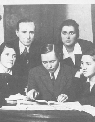
— Профсоюзный комитет Общественного университета им. П.Г.Пестеля осенью 1905г.

студите, в том числе и учебной, руководителем старост. Это была радикально настроенная часть студенчества, которая требовала проведения настоящих реформ высшей школы (иногда такие выступления Наркомпрос относил к контрреволюционным действиям). Старосты выполняли функции профсоюзного комитета, ведая вопросами организации студенческого самоуправления, кассами взаимопомощи, «судами чести», средствами на покупку учебников, книг, трамвайных билетов. По архивным данным, в 1920 году на заседании старостата