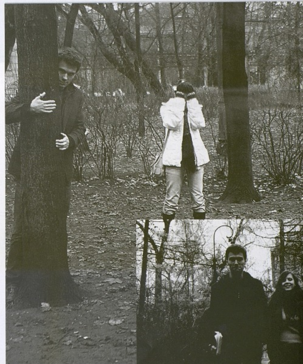
Болонский процесс: первые жертвы

И вообще, глобализация давно в действии. Уже дошла очередь и до системы образования.