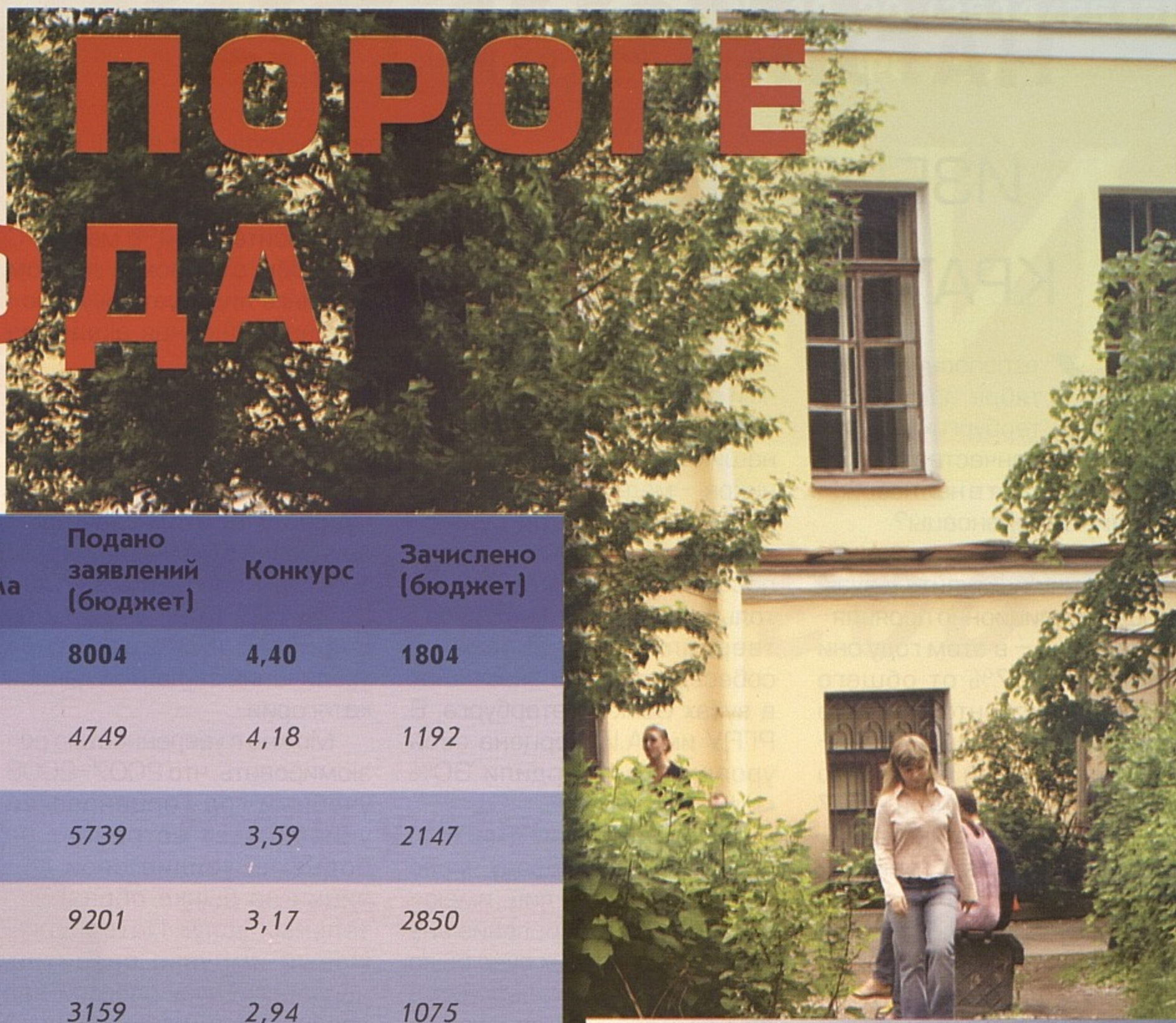
Таблица № 3