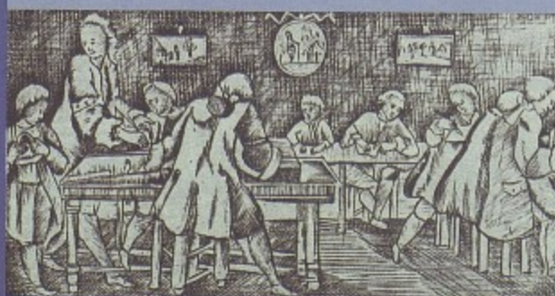
Академическая гимназия — первая в России государственная светская средняя общеобразовательная школа. Гравюра 1701 г.

Вводятся три ступени школьного образования: приходские училища с обучением 1 год, затем двухгодичное образование в уездных училищах и для желающих – 4-летняя гимназия.