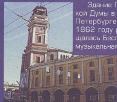
Здание Городской Думы в Санкт-Петербурге, где в 1862 году размещалась Бесплатная музыкальная школа

Начинается переход школ на 11-летнее образование.