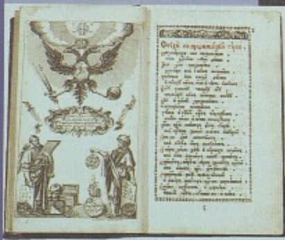
Арифметика Л.Ф. Магницкого, 1703 г. Наиболее известный учебник математики в России в первой половине XVIII века.

Петр I объявляет обязательным для детей всех сословий (кроме крепостных крестьян) обучение грамоте, письму и арифметике.