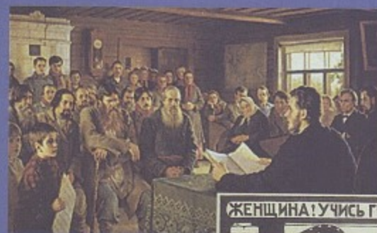
Воскресное чтение в сельской школе. Худ. Н. Богданов – Бельский. 1895. Гос. Русский музей.

Принят университетский устав, предписавший разбить высшее образование на две ступени по схеме «4+1». Новый устав определил правила поступления во все университеты России. По решению ректора, лучших выпускников гимназий принимали без вступительных экзаменов. Образование исключительно платное. Студенты сдают экзамены каждый год и на последнем курсе – итоговый, на ученую степень кандидата. Кандидаты, оставшиеся на кафедрах, через год имели право сдавать экзамены для получения ученой степени магистра. Еще через год магистры могли пробовать защитить докторскую диссертацию.