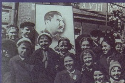
Учащиеся начальной школы в г. Череповец. Конец 1930-х гг.

При Академии наук СССР учреждена докторантура – программа для получения ученой степени доктора наук. Сроки не устанавливаются. Обучение и защита возможны только в Москве при академии.