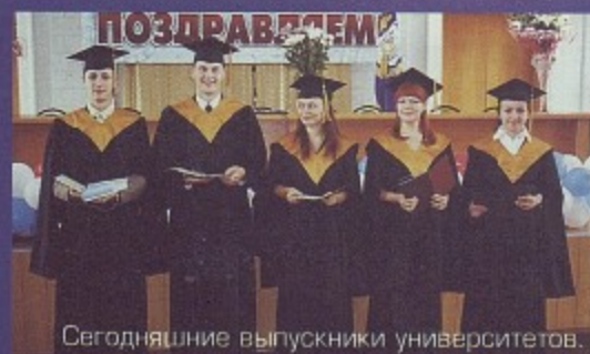
Сегодняшние выпускники университетов.

Введено обязательное 8-летнее образование. Выпускники могли продолжить учебу в школе, техникуме или ПТУ.