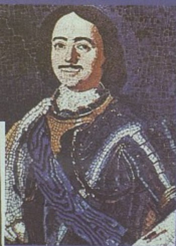
Мозаика работы М.В. Ломоносова, XVIII век.