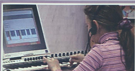
Урок музыки в общеобразовательной школе. Апробационная площадка г. Челябинска.