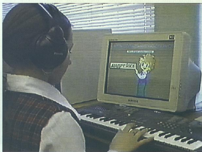
Урок музыки в общеобразовательной школе. Апробационная площадка г. Санкт-Петербурга.

По каждой теме учебного года дополнительно предлагается справочно-информационный материал: краткий биографический очерк о композиторе, чья музыка