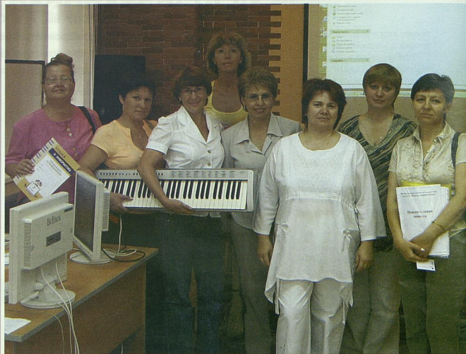
Учителя-апробаторы, г. Челябинск.

Новая программа была поддержана НФПК и стала победителем на конкурсе грантов в номинации «Разработка инновационных учебно-методических комплексов для системы общего образования». Данная программа прошла успешную апробацию в пилотных регионах России и внедряется в образовательный процесс Санкт-Петербурга и Ленинградской области, Карелии, Урала и Западной Сибири.