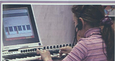
Урок музыки в общеобразовательной школе. Апробационная площадка г. Челябинска.