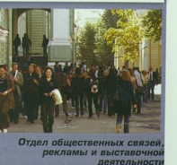
Отдел общественных связей, рекламы и выставочной деятельности