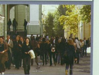
Отдел общественных связей, рекламы и выставочной деятельности