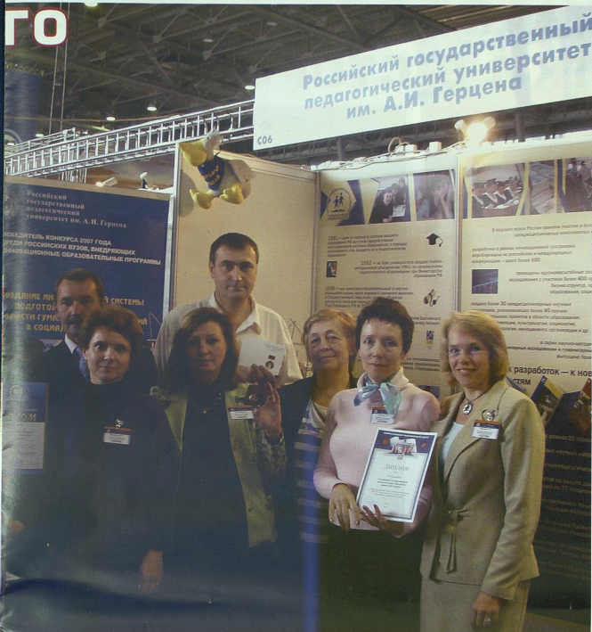
Делегация РГПУ им. А.И. Герцена на стенде университета (после вручения наград). Вверху справа: делегация РГПУ им. А.И. Герцена после вручения наград (после церемонии награждения участников выставки).

формированию информационной компетенции учащихся, которая в современном обществе является одной из ключевых.