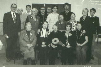
Участники научно-практической конференции 2007 года.

ЛГПИ им. А.И. Герцена произошли существенные изменения, связанные с реорганизацией педагогического образования и объединения ряда институтов в единый педагогический институт.