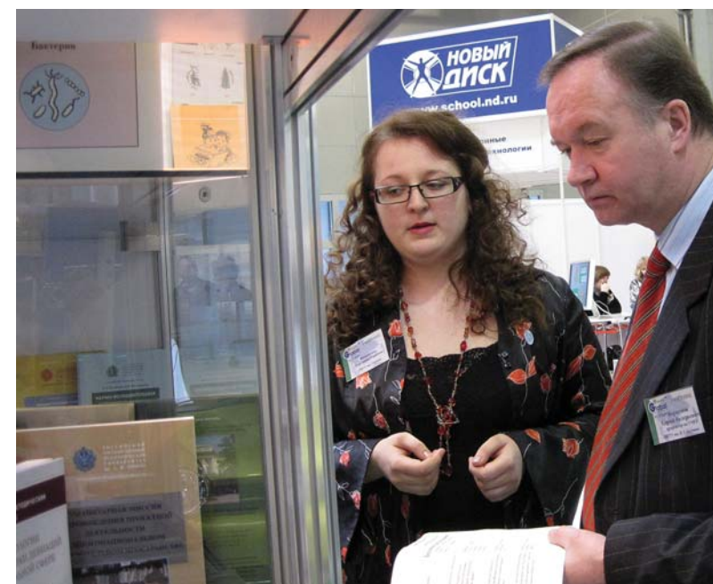
Представление серии научно-методических материалов «Междисциплинарные исследования и гуманитарные технологии».

ных ресурсов, но он же позволяет учителю самому пополнять медиатеку, создавать и редактировать тестовые задания разных видов (в готовых шаблонах), создавать уроки в виде презентаций с гиперссылками на имеющиеся ресурсы медиатеки и тестовые задания.