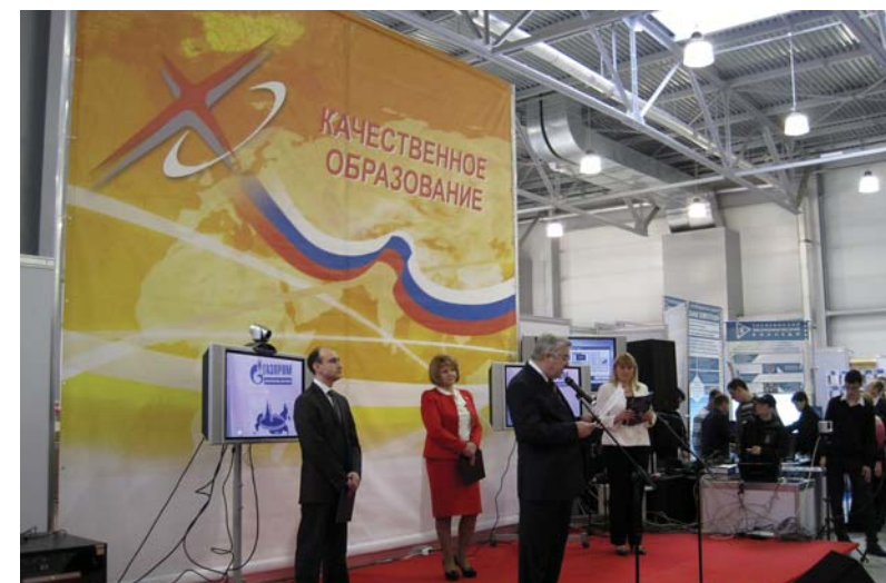
Открытие 3-го международного конгресса – выставки «Global education – образование без границ 2009».

Реализация данного проекта позволила создать и разработать новые образовательные модули, программы и учебные курсы в сфере гуманитарных наук, сформировала научно-методическую основу для дальнейшего развития образовательных процессов. Проект привел к повышению