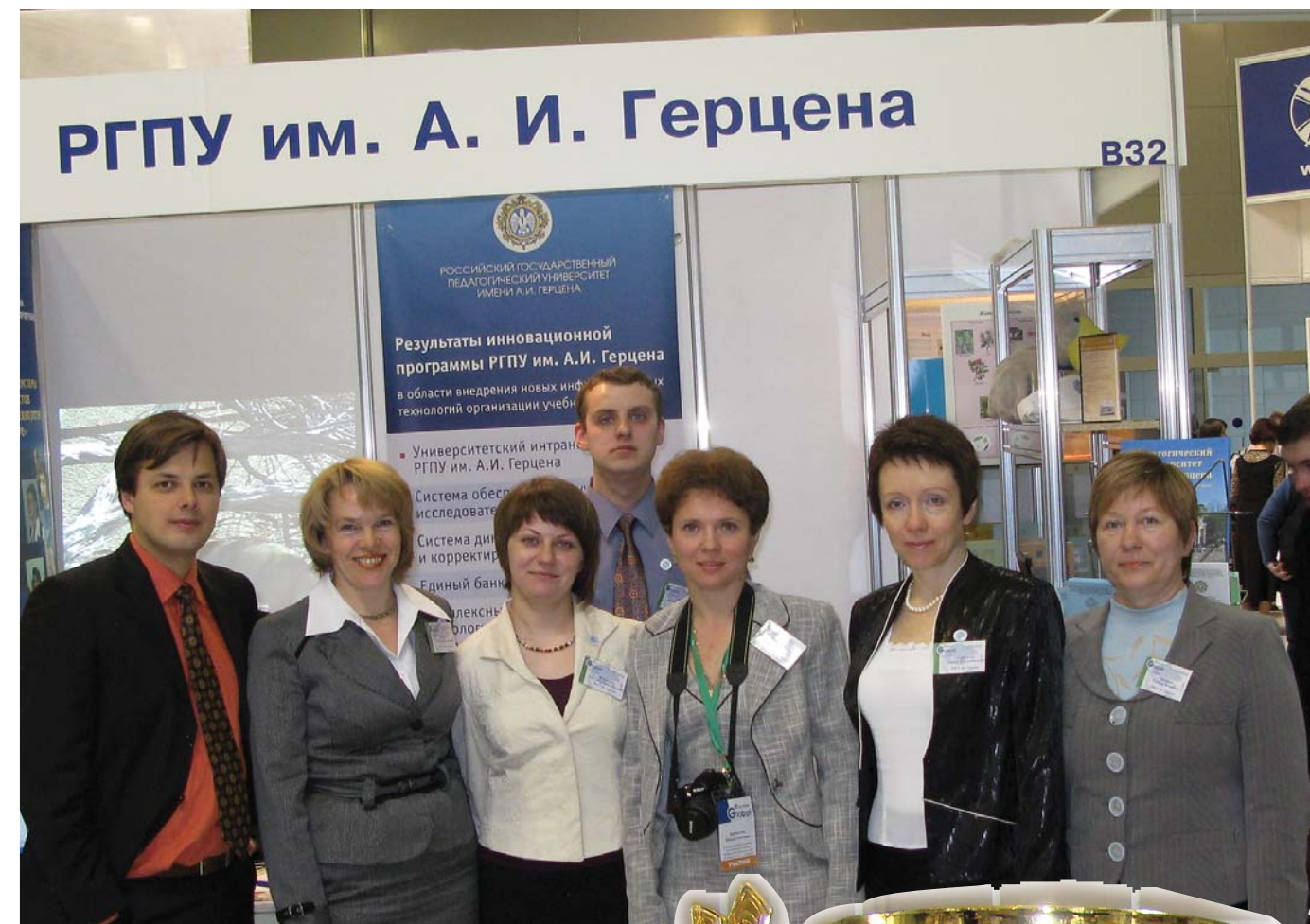
Делегация РГПУ им. А.И. Герцена на Международном конгрессе – выставке «Global education – Образование без границ 2009».

Представленная в экспозиции РГПУ им. А.И. Герцена серия научно-методических материалов «Междисциплинарные исследования и гуманитарные технологии» (руководитель разработки