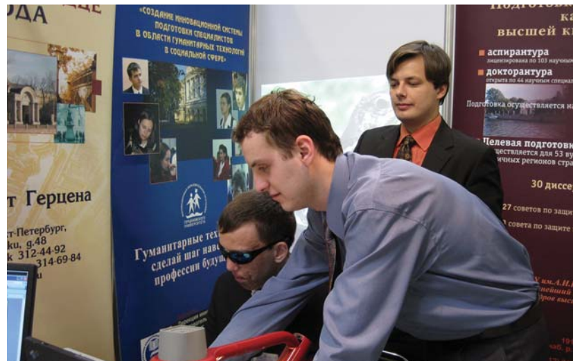
Демонстрация работы методико-технического комплекса для незрячих и слабовидящих.