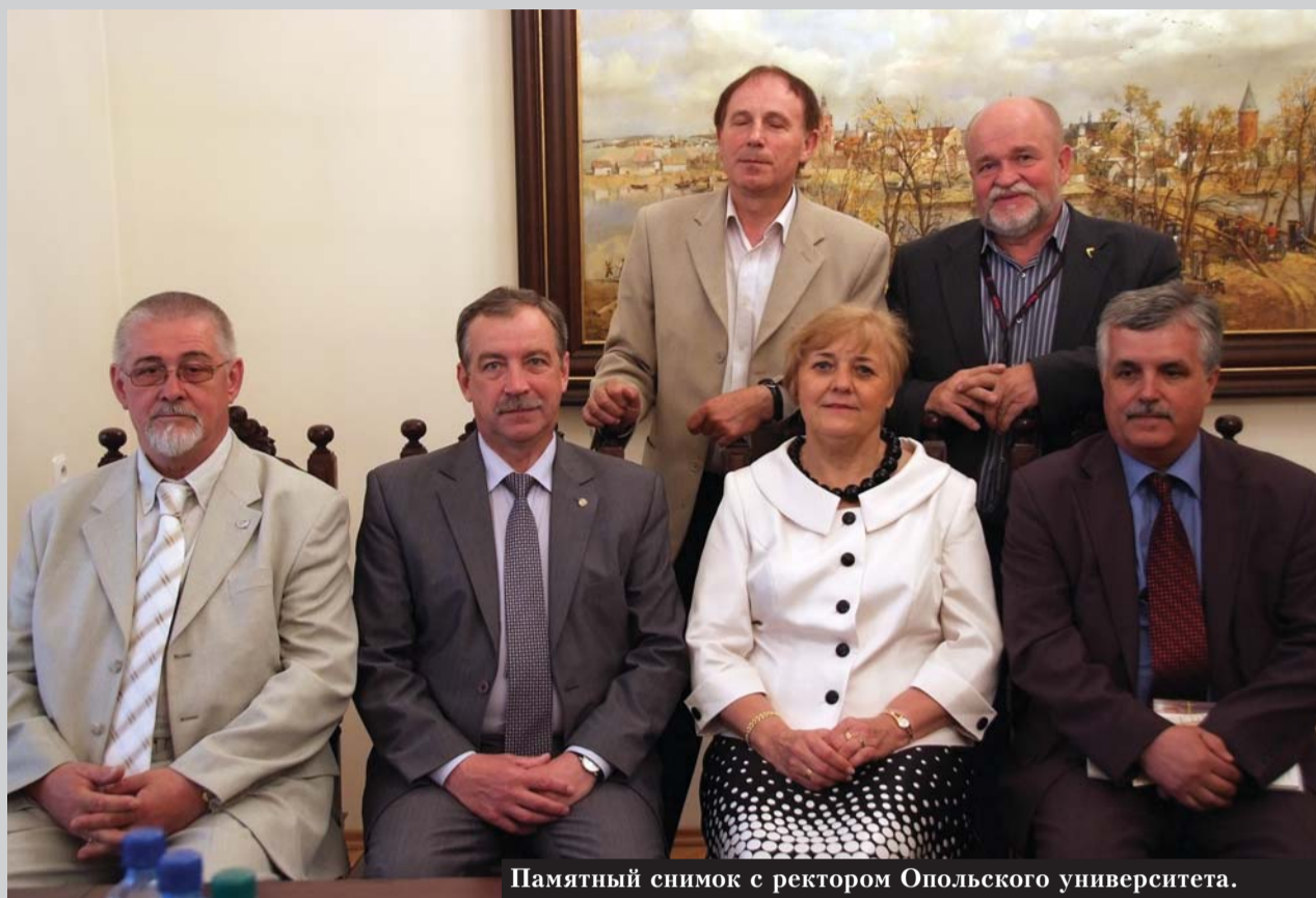
Памятный снимок с ректором Опольского университета.