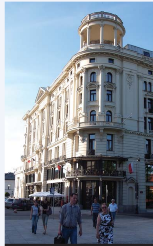
Варшава, здание факультета географии Варшавского университета.

Ополе – столица одноименного воеводства, расположенного на юго-западе Польши. Город лежит по обоим берегам реки Одра. Его население – 130 тыс. человек. Картина города живописна и содержит немало зрелищных маршрутов. Тем временем, главной гордостью жителей, несомненно, является здешний университет. Он был образован в 1994 году путем слияния Педагогического института, филиала Люблинского католического университета и Теологического института. В новом учебном заведении сейчас насчитывается 7 факультетов: экономический, филологический, истории и педагогики, математики, физики и химии, природоведения и технического, теологический, права и управления. Общее количество обучающихся – 19 тысяч человек! Поэтому студенты в Ополе (в городе есть и Политехнический институт) – едва ли не доминирующий социальный слой населения. В этом мы убедились во время очень красочного и содержательного городского фестиваля науки, который проводился накануне конференции.