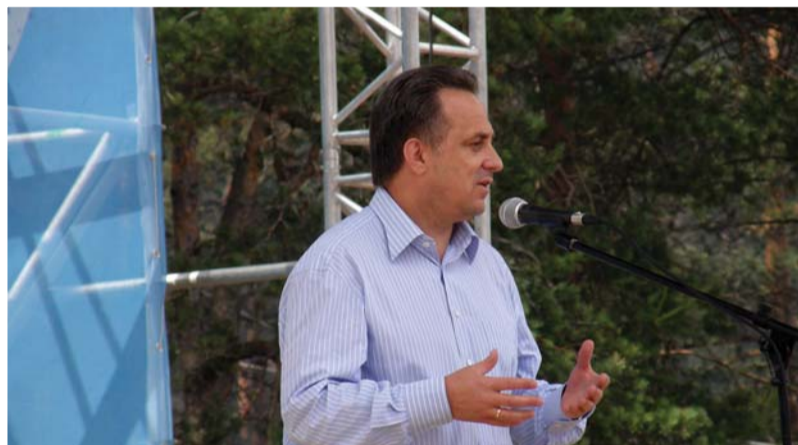
Министр спорта, туризма и молодежной политики Российской Федерации В.Л. Мутко на форуме «Селигер-2009»