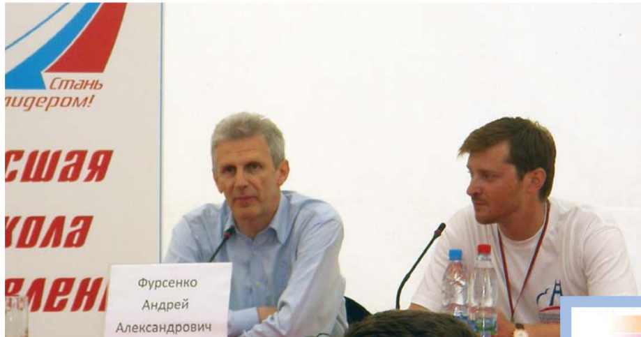
Министр образования и науки РФ А.А. Фурсенко на форуме «Селигер-2009»