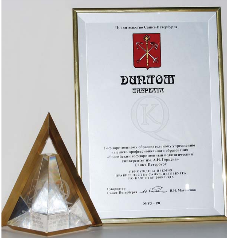
Поздравляем весь коллектив университета с выдающимся достижением и желаем дальнейших успехов в области качества!