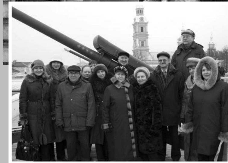
Делегация РГПУ им. А.И. Герцена. Памятник Д.И. Менделеева в Санкт-Петербурге. Серебряная монета, посвященная 175-летию со дня рождения ученого.