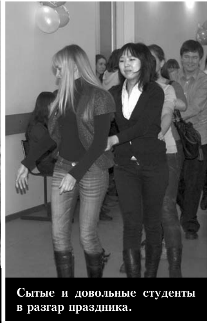
Сытые и довольные студенты в разгар праздника.

но, всем известным студенческим аппетитом. Зажигательные песни, улыбочивые продавцы и ароматные блины создали на факультете атмосферу истинного праздника, позволившую всем хотя бы ненадолго забыть о насущных проблемах и почувствовать настоящее единение со своим факультетом.