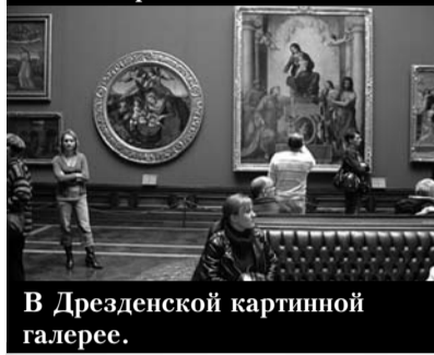
В Дрезденской картинной галерее.