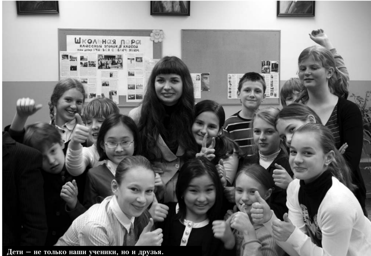
Дети – не только наши ученики, но и друзья.