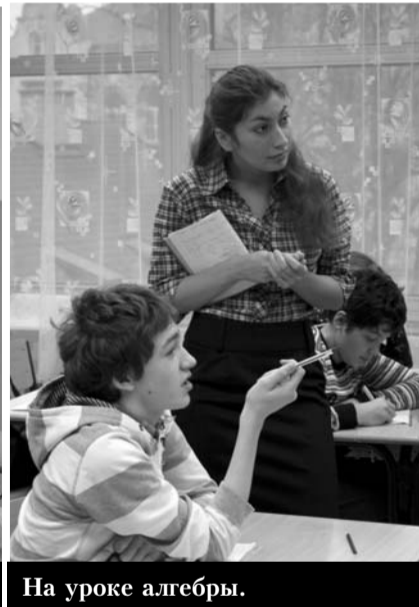
На уроке алгебры.

А всего три-четыре-пять... Всего нас, прилетевших в Прагу, было 13. Кстати, по поводу числа 13 – никаких отрицательных комментариев. Абсолютно никаких! Для нас эта цифра была вполне счастливой. Кстати, у двух девушек нашей чешской команды, день рождения именно 13 числа. Более того, у нас апартаменты под номером 13 были. И ничего, очень даже неплохо нам там жилось, даже Wi-Fi при больших усилиях можно было поймать! Так что, пользуясь случаем, активно выступлю против дискриминации по числовому признаку. Все числа хороши!