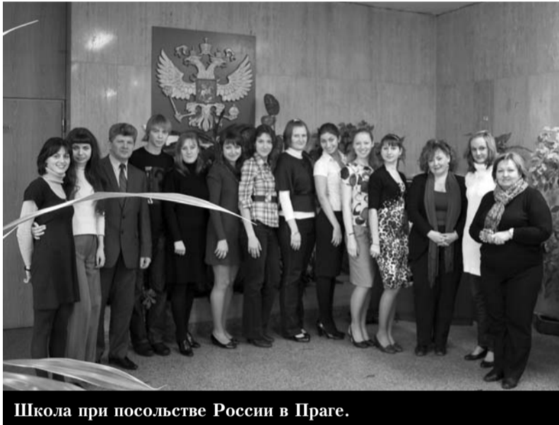
Школа при посольстве России в Праге.