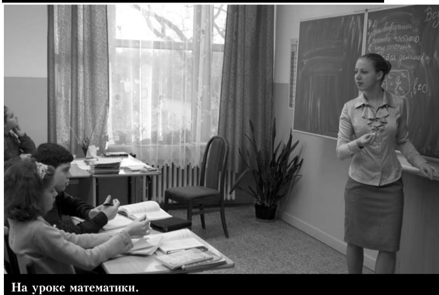
На уроке математики.