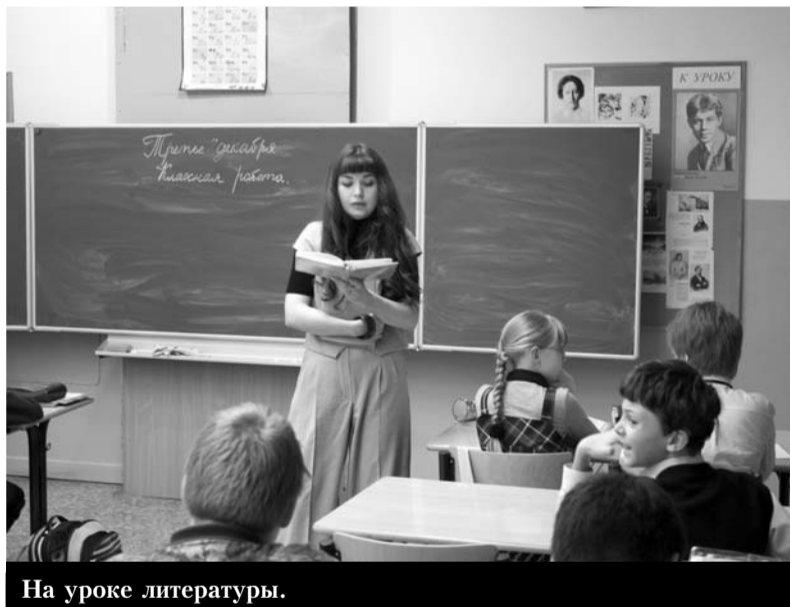
На уроке литературы.