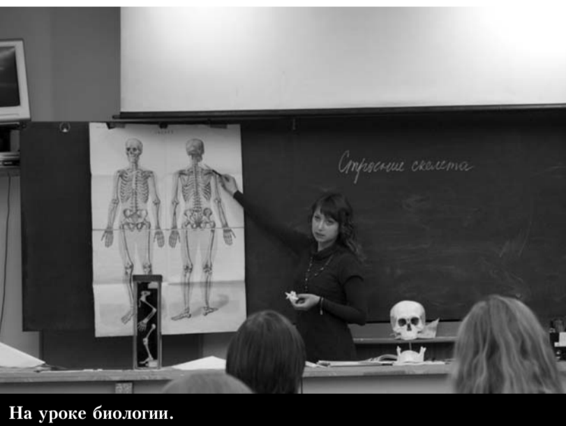
На уроке биологии.