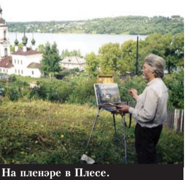
На пленэре в Плесе.