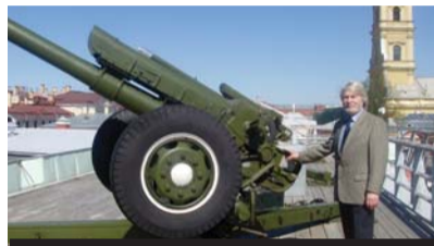
Выстрел на бастионе Петропавловской крепости. 2007 год.