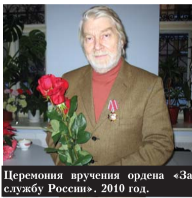
Церемония вручения ордена «За службу России». 2010 год.