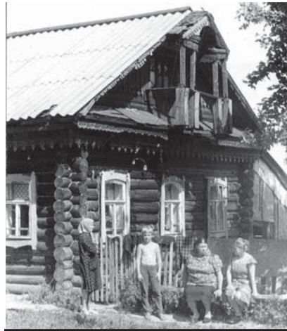
Родной дом в деревне Авдотьино Костромской области.