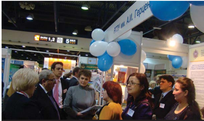
У экспозиции Герценовского университета во время осмотра выставки после церемонии торжественного открытия.