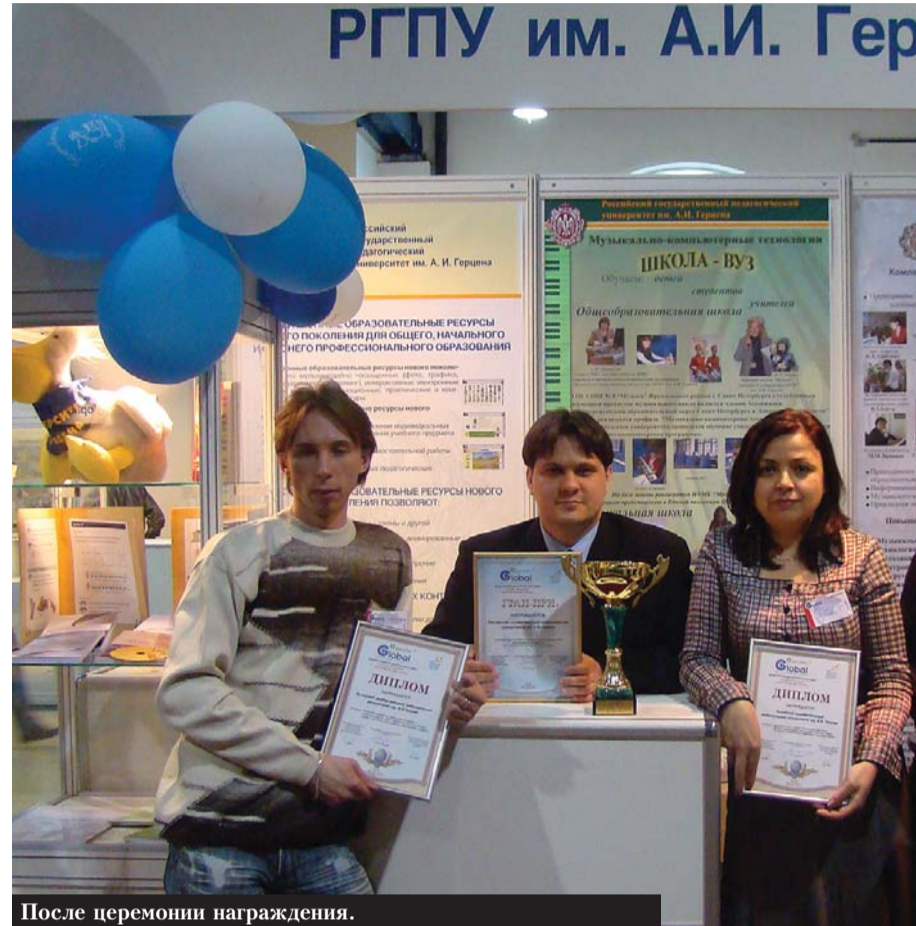
После церемонии награждения.