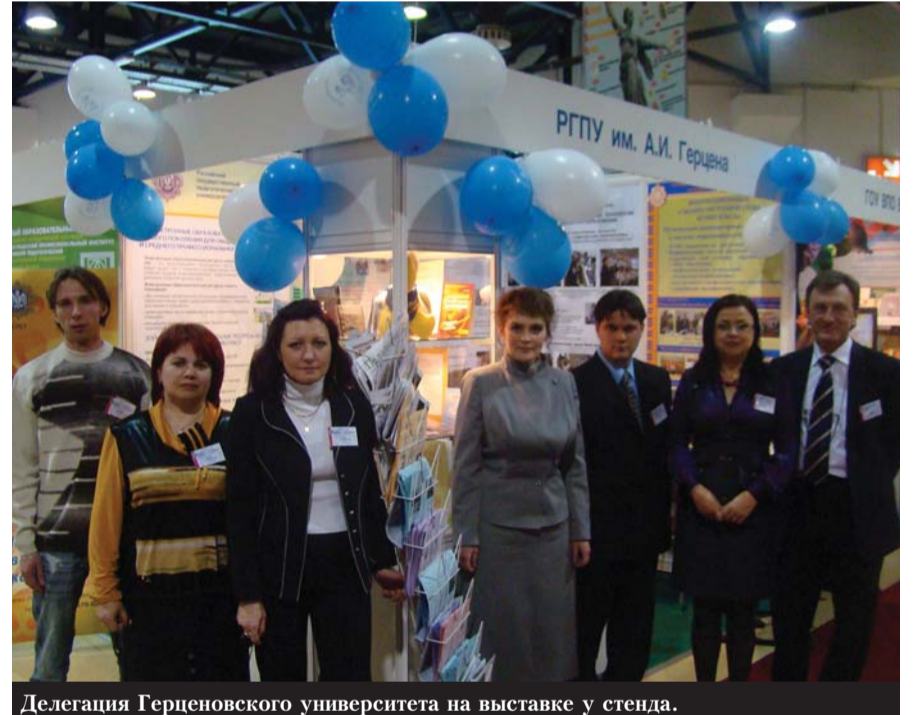
Делегация Герценовского университета на выставке у стенда.