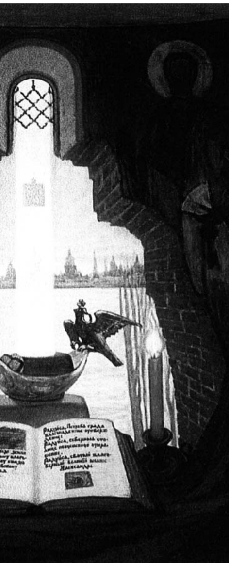
«Блокадного хлеба благость», 2005 г.