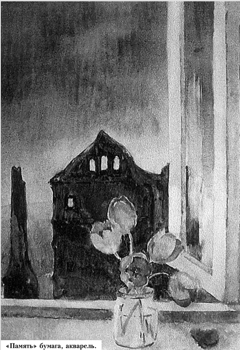
«Память» бумага, акварель.