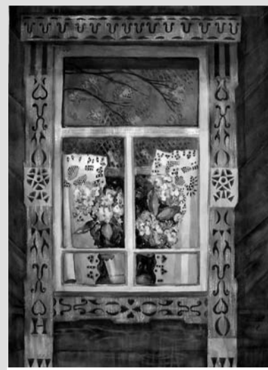
«Окно с голубым наличником» бумага, акварель.