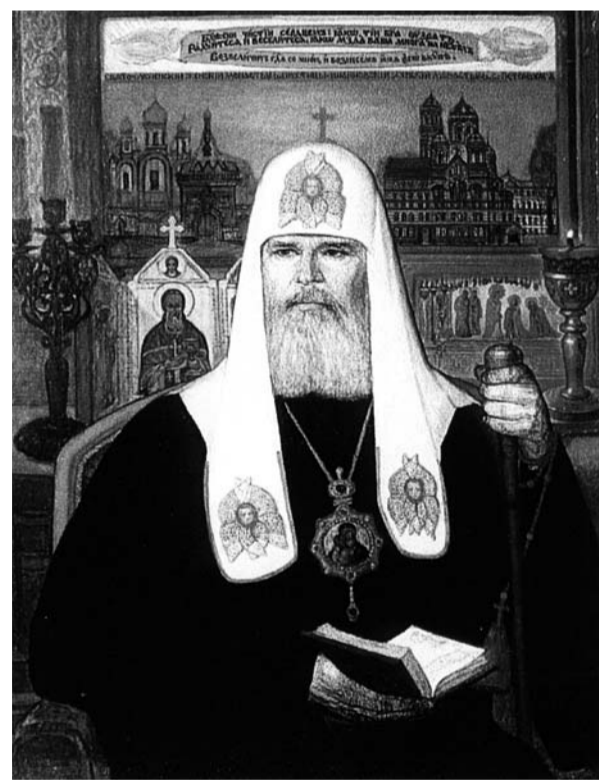
«Портрет Патриарха Алексия II» 2005 г.

всегда бывает плодотворно. Частовещении с коллегами, студентами и аспирантами Пётр Александрович щедро делится своим жизненным опытом. Когда он рассказывает о себе, создаётся впечатление, что человек прожил не одну, а несколько жизней. Были радостные и трагические эпизоды. Удивительно, что, пройдя через невероятные трудности, пережив немалые испытания, которые выпали на историю