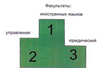
Специалитет Рис. 5