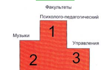
Магистратура Рис. 6