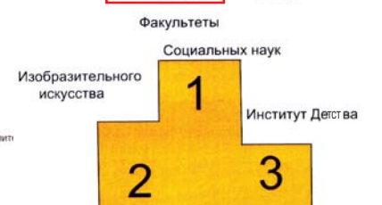
Бакалавриат Рис. 7