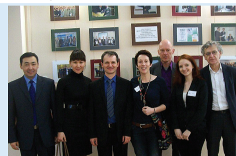
Участники Европейской недели – российские, голландские и казахские коллеги в холле факультета управления.