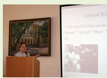
На заседании студенческого научного общества