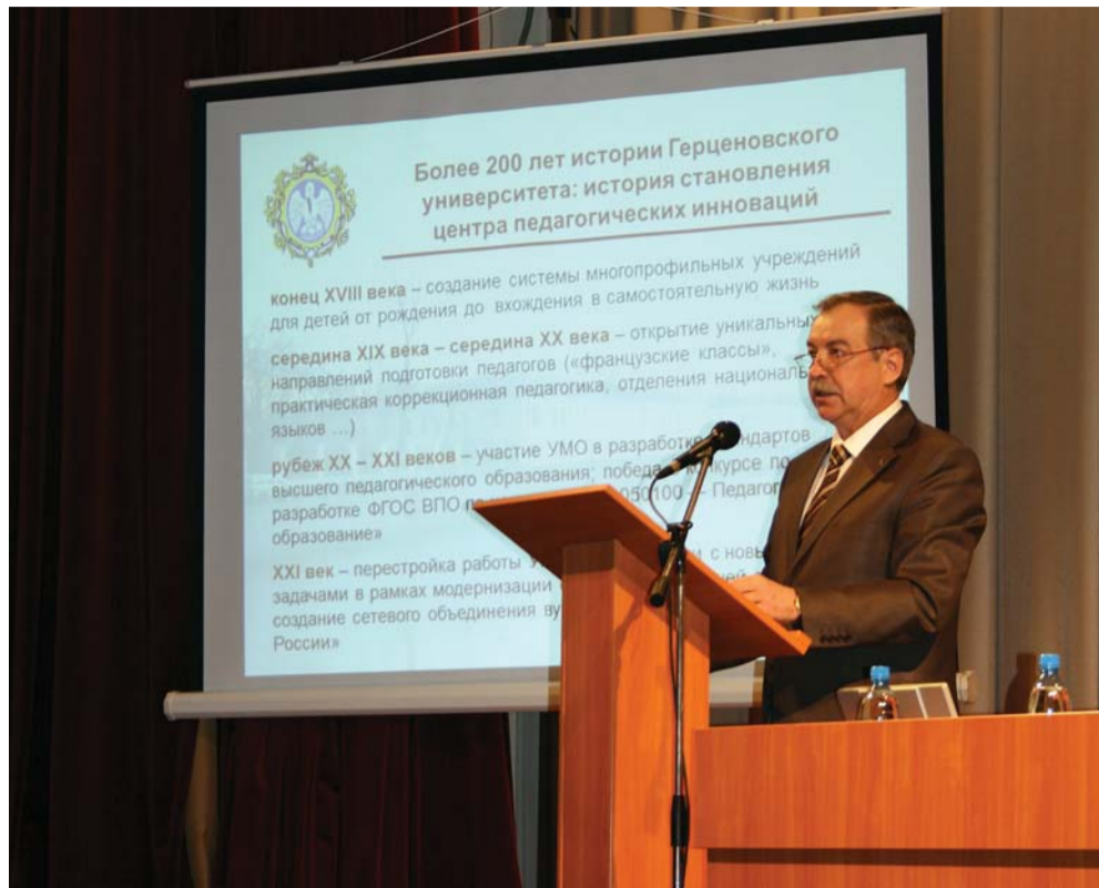
Выступление ректора Герценовского университета В.П. Соломина.