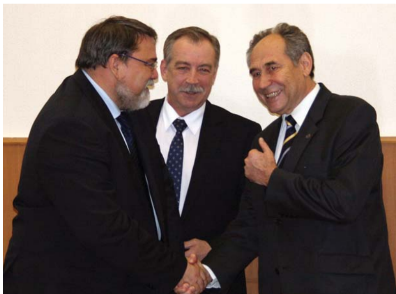
Глава ФАС И.Ю. Артемьев, ректор В.П. Соломин и президент Герценовского университета Г.А. Бордовский.

«Я рад, что Герценовский университет занимает высокие позиции и широко известен в России и за рубежом. Есть уни-