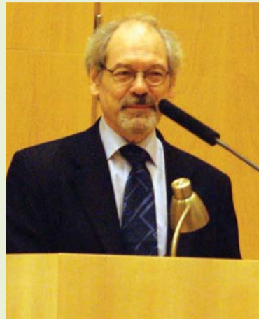
Генеральный консул Финляндии в Санкт-Петербурге Олли Перхеентупа открывает международный семинар «Перспективы российско-финского сотрудничества в области раннего обучения иностранным языкам».

скими наблюдениями, совместный анализ полученных материалов в контексте рассмотрения позиций двух разных культур. Всё это расширило представления участников семинара о возможностях обучения иностранным языкам в раннем возрасте.