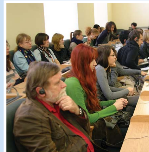
Слушатели лекции — студенты, преподаватели и гости Герценовского университета.

Герценовский университет посетил французский художник Массан. Икона европейской книжной графики, дизайнер, типограф — он прочел лекцию о «Взаимодействии искусств». Французский гость красил буквы в цвета, говорил о совершенной гармонии и о музыке сфер.