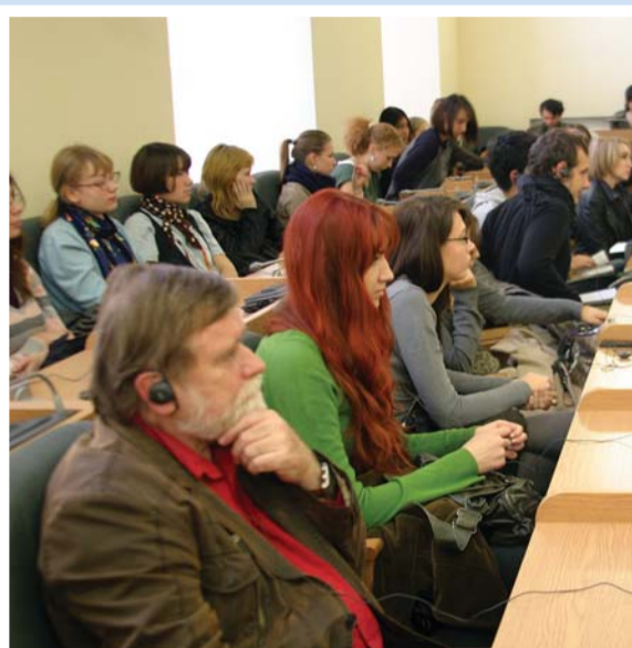
Слушатели лекции – студенты, преподаватели и гости Герценовского университета.

«Звук, цвет, запах и форма имеют одно происхождение, – объяснял он, одновременно подтверждая главную идею своей лекции цитатами из Блеза Паскаля, Джорджа Беркли, Оноре де Бальзака и других философов. По мнению