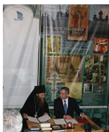
Подписание двустороннего соглашения о сотрудничестве.