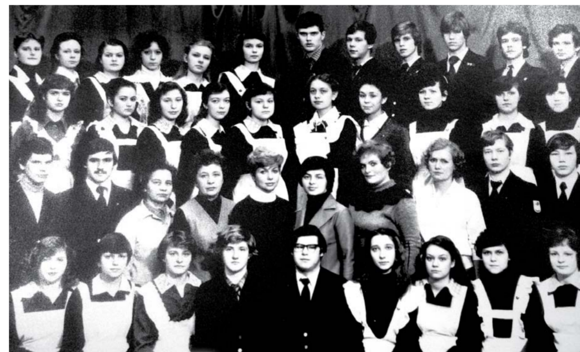
ШКОЛА № 305 ЛЕНИНГРАД 1981-1982