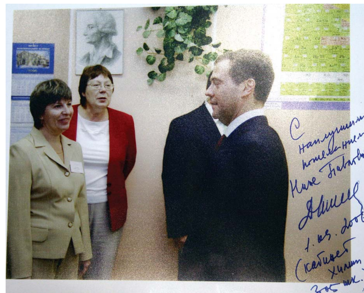
Посещение Д.А. Медведевым родной школы № 305 и кабинета химии. Фотография с дарственной надписью Н.П. Ерюхиной.