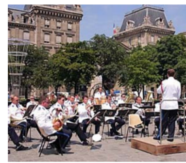
Праздник музыки в Париже. Оркестр играет на площадке возле мэрии.