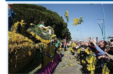
Забавная традиция — кидаться мимозой — реализуется на Фестивале мимозы.

Музыку в этот день можно услышать повсюду: в концертных залах, на улицах, в квартирах. Все, кто умеет играть — играют, кто умеет петь — поют, танцевать — танцуют; те, кто лишен всяческих талантов — слушают исполнителей, а все вместе наслаждаются музыкой и радуются жизни. Проводятся парады оркестров, концерты, в которых принимают участие и известные и не очень