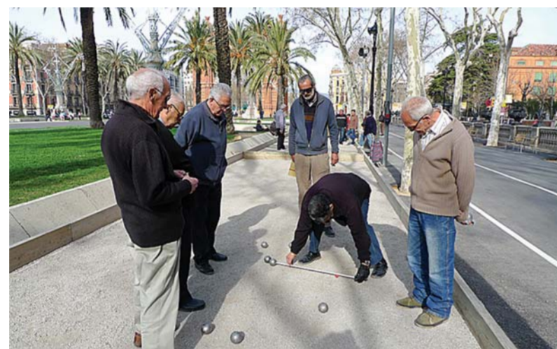
Игроки в петанк на улице.