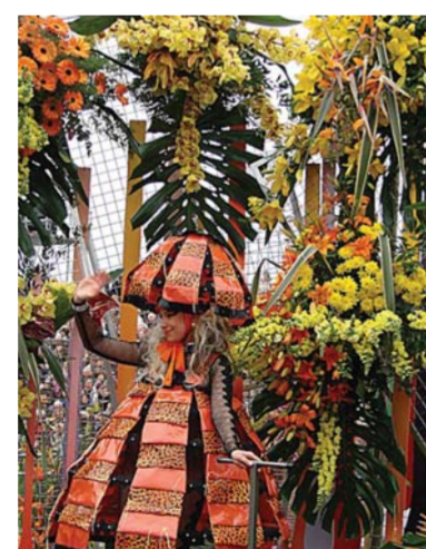
Цветочный карнавал в Нице, проводящийся в конце Фестиваля мимозы.