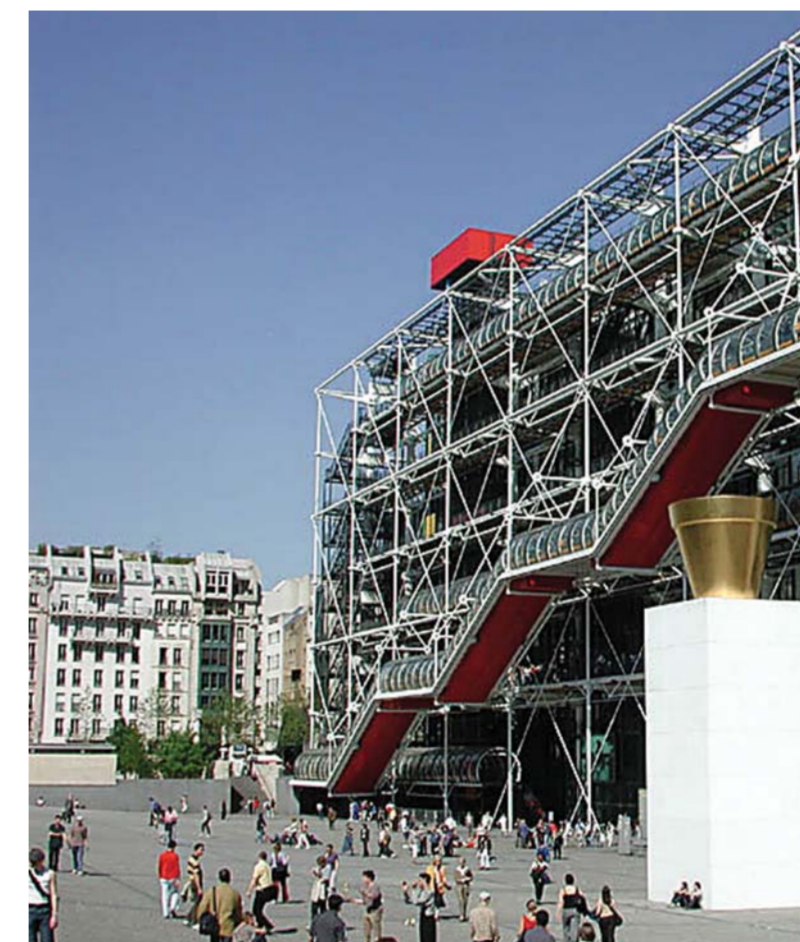
Центр Жоржа Помпиду.