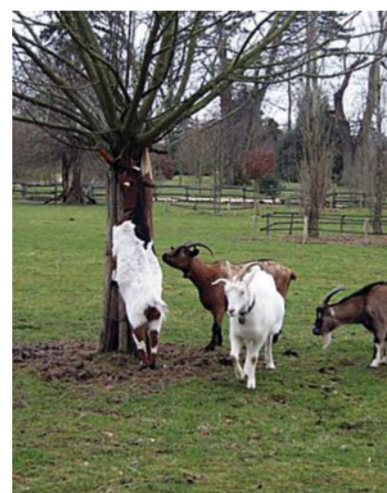
Козы в парке Версаля, владения Марии-Антуанетты.