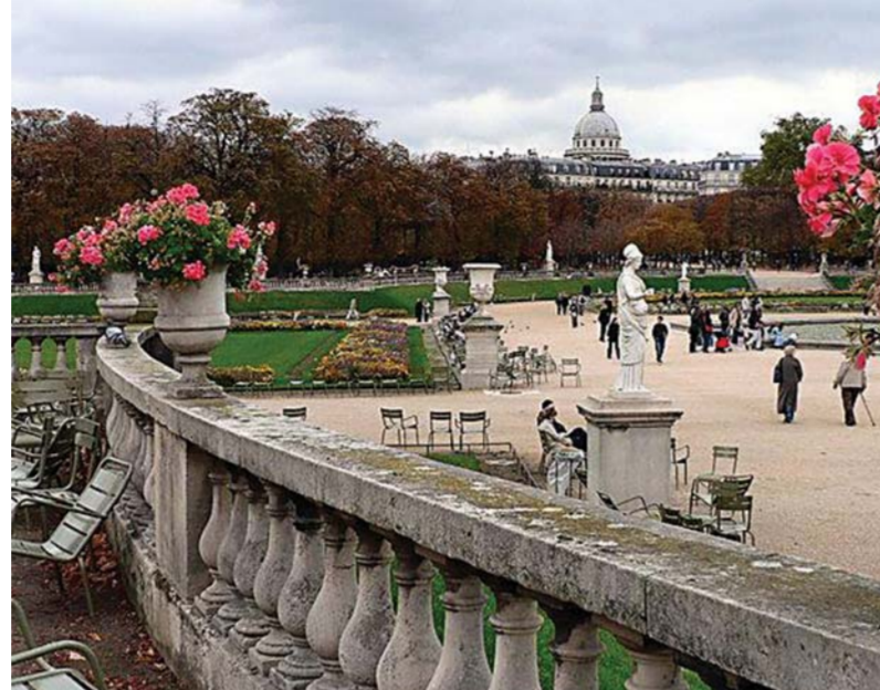
Люксембургский сад весной, Париж.

Естественно, послевоенная мода создавалась не только Диором. Пятидесятые — это время расцвета и славы Модного дома