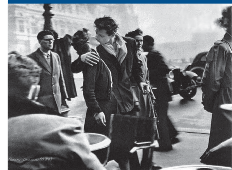
«Поцелуй влюбленных у мэрии Парижа». Снимок был сделан известным французским фотографом Робером Дуано в 1950 году, работавшим в то время над серией фотографий о парижских влюбленных. Только спустя тридцать с лишним лет фото заметила одна компания по производству плакатов. Именно с этого момента и началась всемирная известность снимка. Многие считали его спонтанным, однако на самом деле фотография была постановочной.

числе произведения таких авторов, как Сальвадор Дали, Пабло Пикассо, Василий Кандинский, Марк Шагал, Казимир Малевич, Анри Матисс и др.