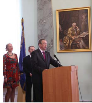
Ректор Герценовского университета поздравляет участников проекта