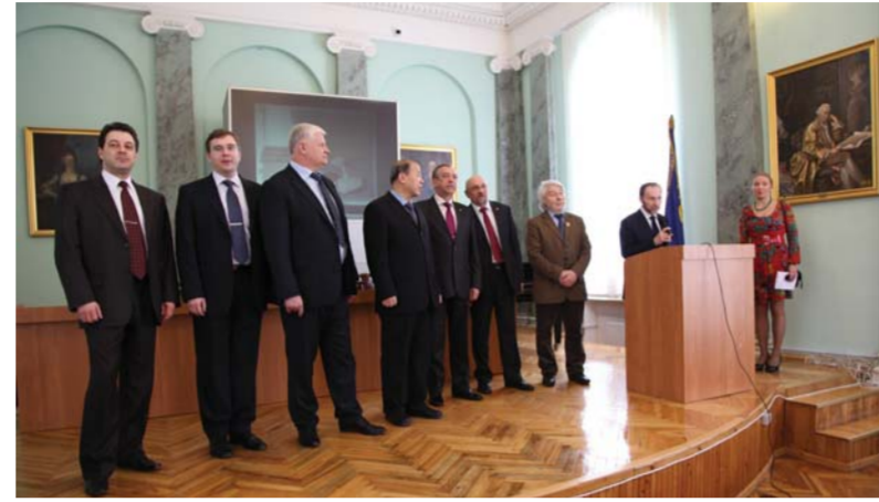
Ректорат на церемонии открытия выставки