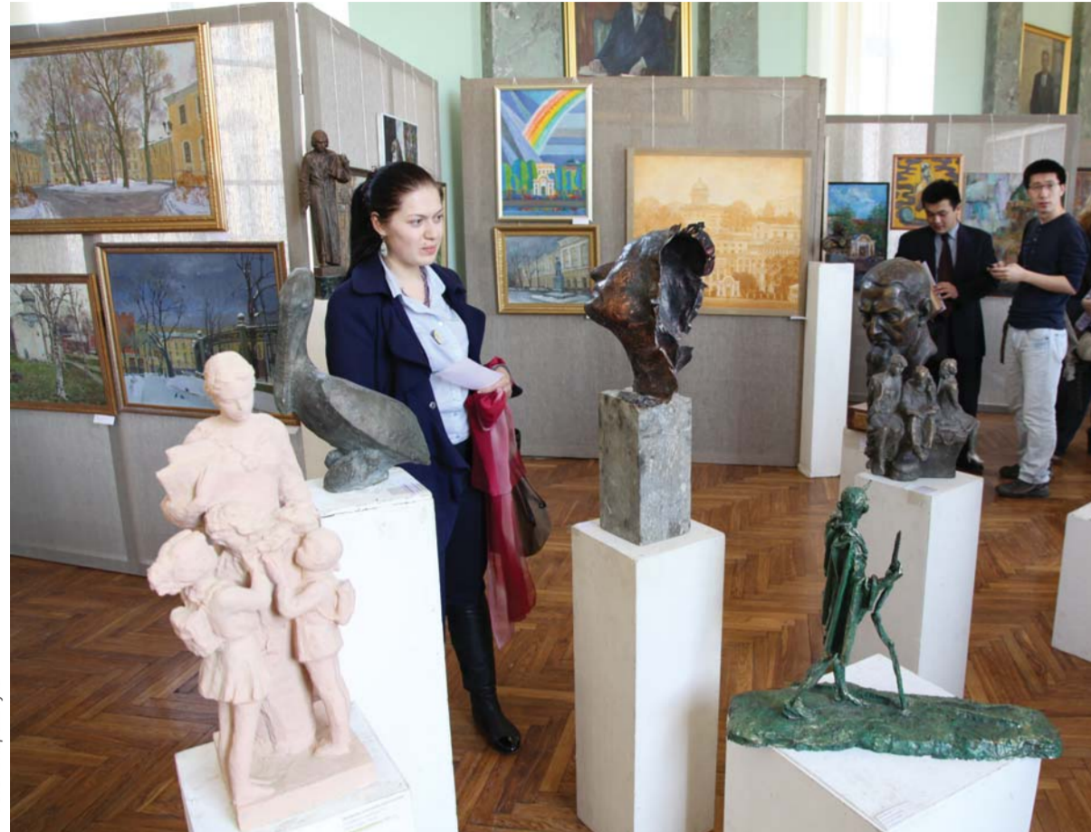
На экспозиции выставки «Герценовский университет в сердце Петербурга»