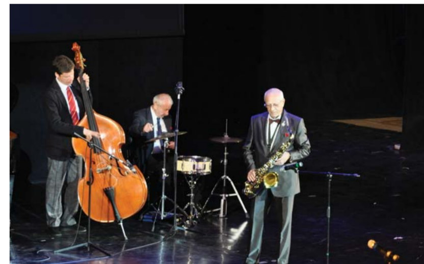
На сцене – народный артист России, профессор Герценовского университета Давид Голощекин и его ансамбль