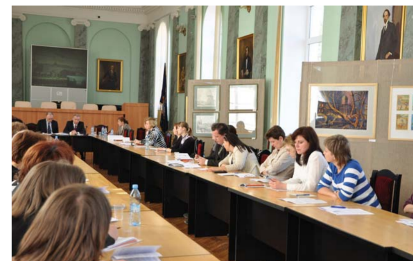
Дискуссионная площадка «Какое образование становится фактором конкурентных преимуществ»