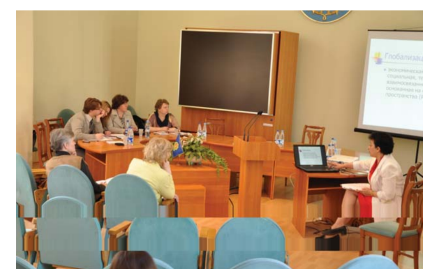
Дискуссионная площадка «Самореализация студента в условиях множественных контекстов образования»