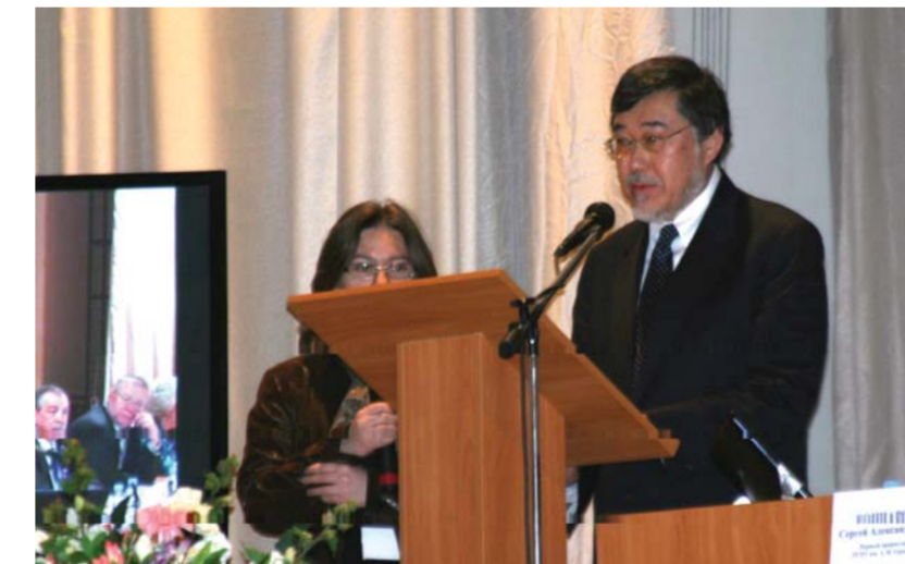
Выступление президента Международной ассоциации школ права (IALS) на заключительном пленарном заседании