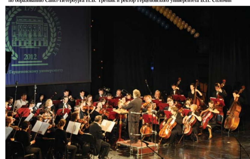
Герценовцы на сцене «Мюзик-Холла» приветствуют оркестр «Классика» под управлением заслуженного артиста РФ, профессора Герценовского университета А.Я. Канторова