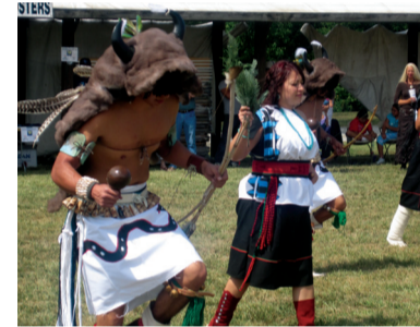
Ежегодный фестиваль культуры коренных жителей штата

Факультет педагогики (School of Education) состоит из четырех кафедр: 1) кафедра Curriculum and Teaching занимается анализом учебных программ, методических рекомендаций и изучением опыта преподавания отдельных предметов на национальном и международном уровнях; 2) на кафедре Educational Psychology готовят школьных психологов; 3) кафедра Educational Leadership готовит будущих директоров школ; 4) кафедра Special Education готовит учителей для детей с ограниченными способностями. В недавнем рейтинге университетов США этот факультет занял восемнадцатое место. Для меня открытием стал тот факт, что там изучается в основном школьное и дошкольное образование, а методикой обучения взрослых занимается отдельный центр прикладной лингвистики (Applied English Center), который по сов-