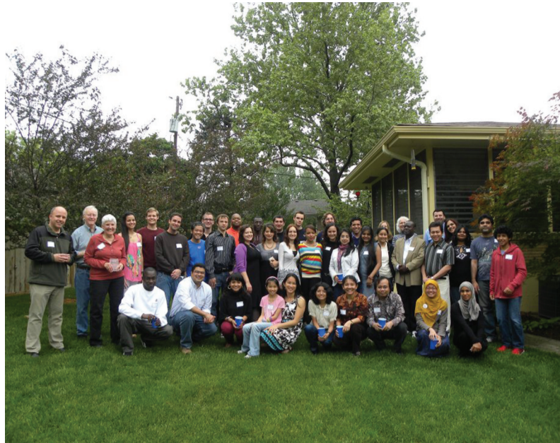
Студенты-стипендиаты программы Фулбрайта на ежегодном пикнике