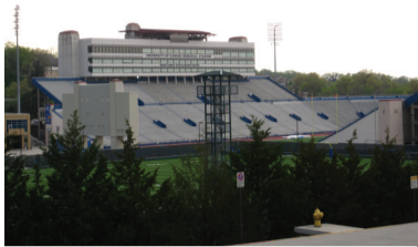
Гордость университета – футбольный стадион