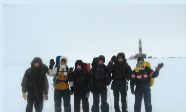
Юные полярники – учащиеся гимназии № 116