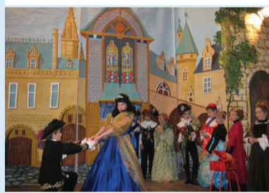
Сцена из спектакля театра «Исторических миниатюр»

проекта «Грумат». Группа юных полярников состояла из учащихся 116-й гимназии. «Маршрут проходил по территории национального заповедника Норвегии, где очень красиво, множество горных рек, снежников и ледников. Сложность экспедиции заключалась в том, что группа прошла по кольцевому маршруту 200 км и вышла на берег самого северного фьорда «Ауст-фиорд, за которым земли уже нет – только Северный полюс. Несмотря на шквальный ветер, сломанную палатку и то, что мы переходили горные реки вброд при температуре 2–4 градуса, группа осуществила маршрут, по которому много лет назад ходили только российские геологи. Наш был оценен как маршрут 3-й категории сложности (высший)».