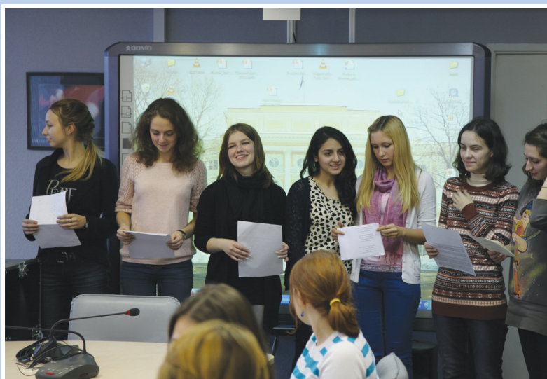
Студентки исполняют песню на шведском языке