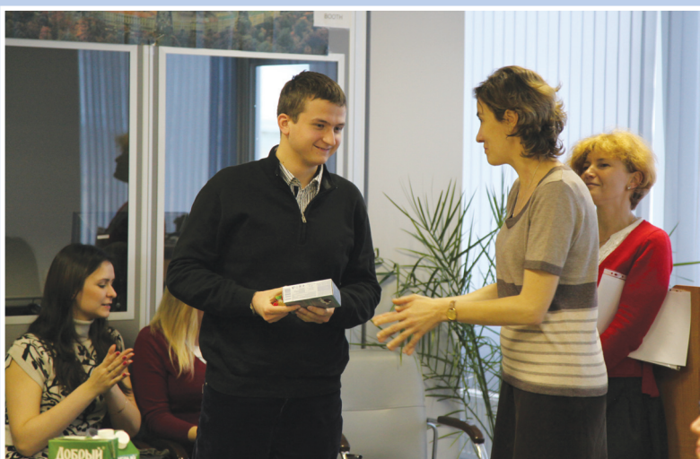
Награждение победителей викторины