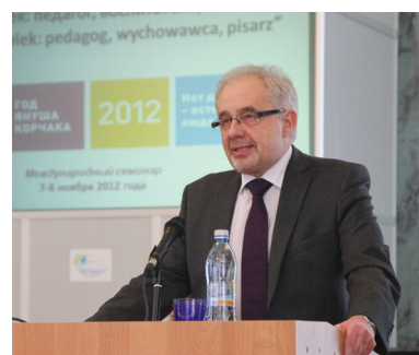
Генеральный консул Республики Польша в Санкт-Петербурге П. Марциняк