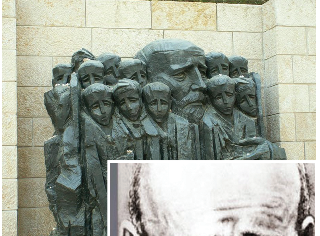
Памятник «Я. Корчак с детьми», Б.Сакциер, Иерусалим

7 ноября в рамках программы конференций «Дни Януша Корчака в Санкт-