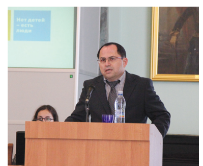
Генеральный консул Государства Израиль в Санкт-Петербурге Э. Шапира