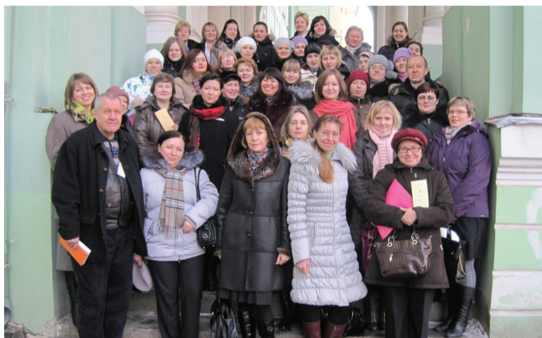
Общее фото на память.

смысла изображения было предложено изложить в письменной форме. На втором этапе, работая в командах, участники были включены в дискуссию, в ходе которой было необходимо создать командное видение педагогической ситуации