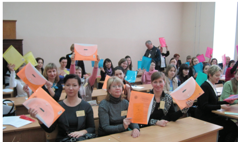
Участники ежегодной герценовской педагогической олимпиады магистрантов «Эврика: научный поиск».