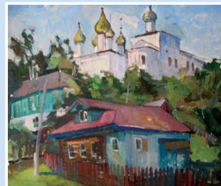
Л. Дутов «Гороховец» холст, масло, 2012