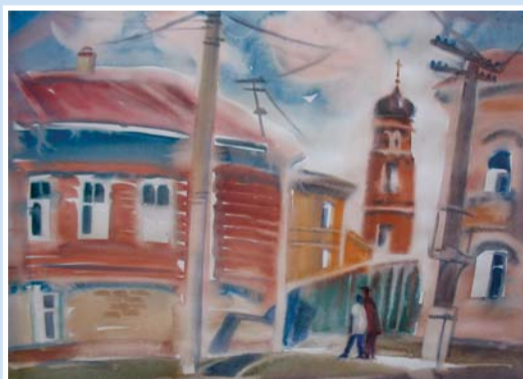
О. Шаюнова «Весна в Волхове» бумага, акварель, 2012

акварелей и живописных картин, передаёт нежные мотивы тихой русской провинции, неспешность ритмов, лирическую симфонию природы и архитектуры и через божественную гармонию цвета ведёт зрителя к размышлениям о непреходящих ценностях бытия.