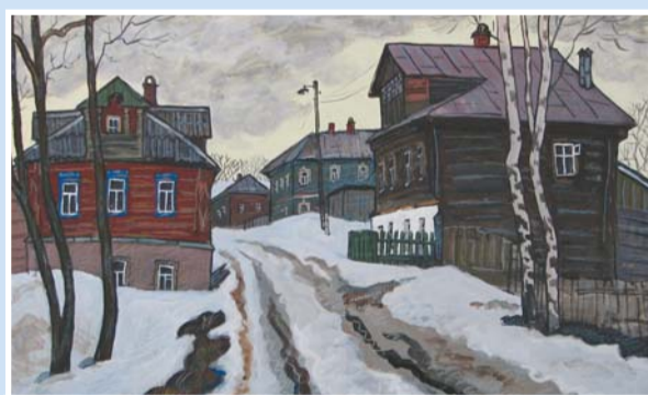
Н. Пушпина «Кострома. Ипатьевская слобода» бумага, смешанная техника, 2012

Таких мест в нашей стране больше семисот пятидесяти, тем более, интересно узнать о некоторых из них, получить впечатления, переданные художниками – людьми увлеченными, неравнодушными к их истории и неброской красоте. В выставочном пространстве медиазала библиотеки № 4 ЦБС Московского района представлены работы, родившиеся в результате поездки по городам Владимирской, Вологодской, Орловской и других областей. Экспозиция, состоящая из