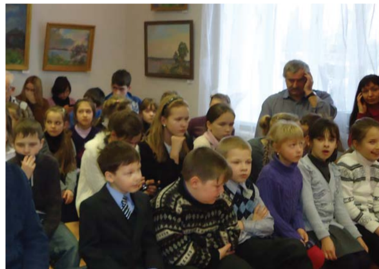
Ученики Сиверской детской школы искусств имени И.И. Шварца