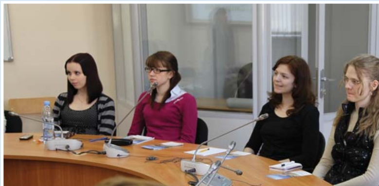
Студенты первых курсов факультетов изобразительного искусства и психолого-педагогического, изучающие итальянский язык

С сентября 2012 года в нашем университете успешно развивается программа обучения итальянского языка представлен как в качестве основной учебной дисциплины «Иностранный язык» на факультетах, так и до-