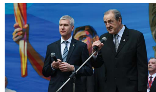
Президент Международной федерации студенческого спорта Клод Луи Гальен, президент Российского студенческого спортивного союза О.В. Матыцин

Президент Международной федерации студенческого спорта Клод Луи ГАЛЬЕН