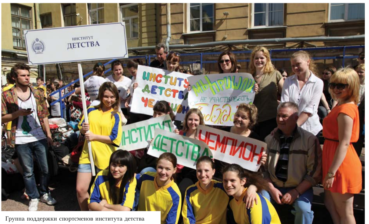
Группа поддержки спортсменов института детства