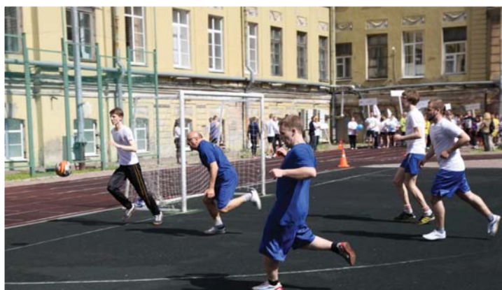
Товарищеский футбольный матч между командами администрации и студентов Герценовского университета. 3:0 победу одержали студенты.