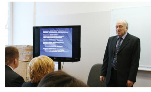
Профессор И.И. Хинич знакомит руководителей системы образования Ленобласти с лабораторией нанотехнологий факультета физики

«Нам весьма отраднo констатировать, что среди поступивших в Герценовский университет в 2012 году – почти 400 человек – это посланцы Ленинградской области»