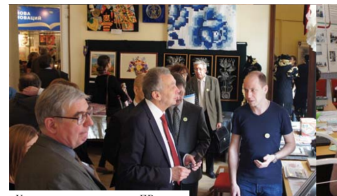
У стенда редакции газеты «ПВ»