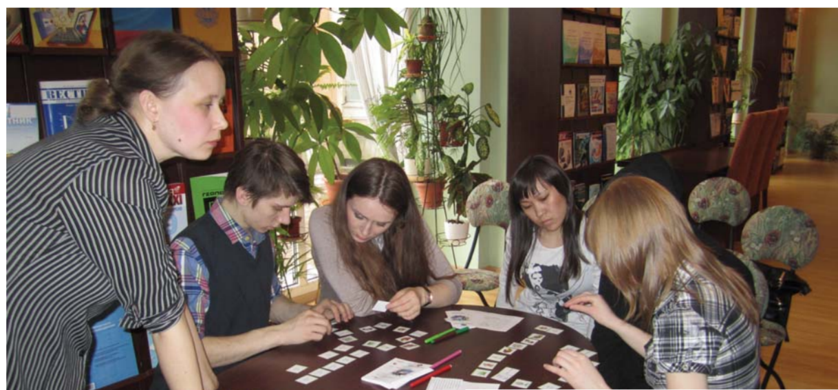
Вечер немецкого языка в зимнем саду Фундаментальной библиотеки университета

го и Ханты-Мансийского государственного университетов, учителя финского и английского языков и школьники средних школ г. Санкт-Петербурга, преподаватели и студенты из Кореи, Китая, представители отдела молодежных проектов Александринского театра и представители издательства «Макмиллан» и «Лонгман» в Санкт-Петербурге. В течение двух лет как форма проведения мероприятий, так и тематика декады были чрезвычайно широки и разнообразны. Примечательно, что все творческие задания и учебно-образовательные мероприятия организованы в рамках определенных целевых направлений. Формированию уважения к культуре других стран и развитию интереса к зарубежной литературе послужил конкурс декламации – чтение художественного текста на изучаемом иностранном языке. IV межвузовский интернет-