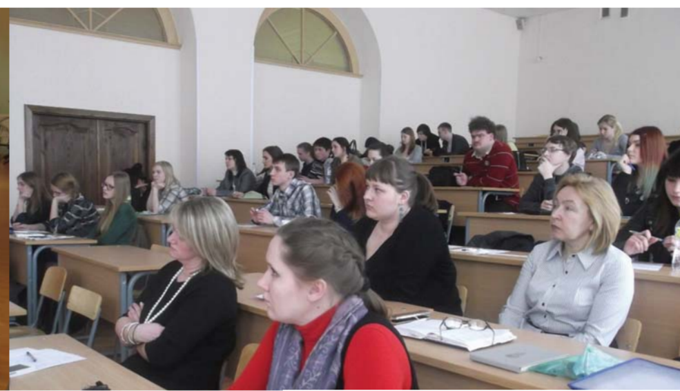
На межвузовской практической конференции «Санкт-Петербург и Дом Романовых»