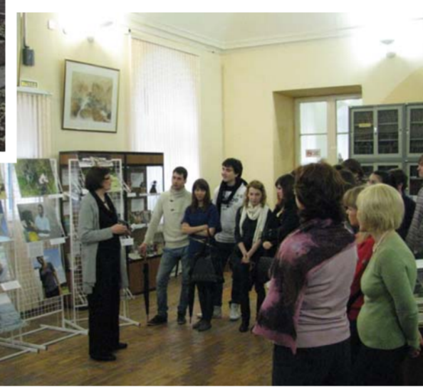
Выставка-отчет о международном проекте «Лица юности»

конкурс творческих работ на английском языке «Вдумчивый интерпретатор» в значительной степени стимулировал интерес студентов к переводческой деятельности. Более тридцати студенческих работ участвовали в данной номинации. С целью обмена опытом обучения иностранным языкам и координации работы в области иноязычной подготовки студентов на филологическом факультете, на факультетах музыки, химии, физики, иностранных языков, института народов Севера, философии человека и психолого-педагогическом прошли конкурсы презентаций, переводов, эссе, отзывов на культурные события и т.д. Среди конкурсов на лучший перевод особо стоит отметить к культуре других стран и развитию интереса к зарубежной литературе послужил конкурс декламации – чтение художественного текста на изучаемом иностранном языке. IV межвузовский интернет-