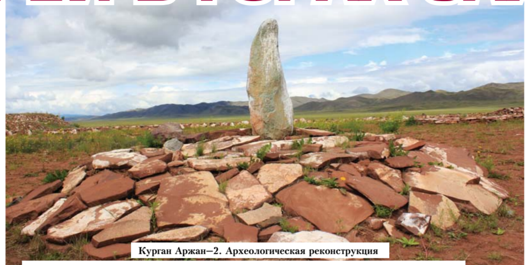
Курган Аржан-2. Археологическая реконструкция

Помимо привычного для народов Сибири шаманизма, прижились на тер-