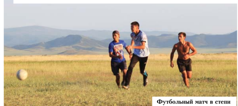
Футбольный матч в степи