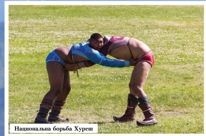
Национальная борьба Хуреш