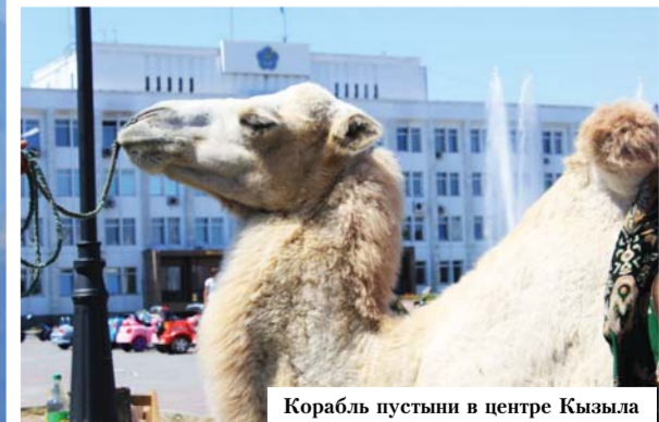
Корабль пустыни в центре Кызыла

Помимо лошадей, а также традиционных коз, овец и коров в республике разводят северных оленей, яков и верблюдов. На верблюдах и оленях также устраивают скачки. При желании любой турист может прокатиться на верблюде на главной площади столицы Тывы – города Кызыла.