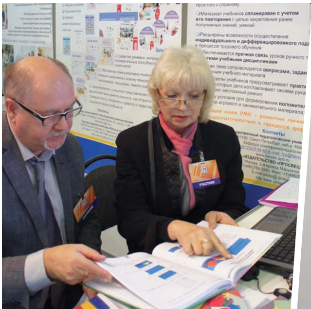
Во время работы конкурсной комиссии на Всероссийском форуме «Образовательная среда 2013»