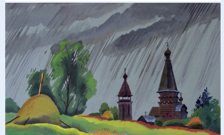
Ксения Почтенная, «Онега», бумага, акварель, 2012 год

На выставке представлены графические работы художников А.И. Мажуги и К.О. Почтенной, выполненные по впечатлениям от путешествий по Ленинградской области. Авторы дают возможность увидеть образцы финского функционализма XX века на севере Приладожья, шатровые храмы на юге Прионежья, курганы на берегах Волхова.