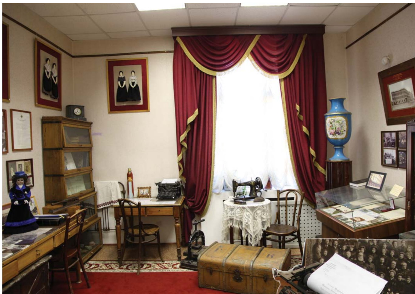
Обновленная экспозиция Музея

– Музей сотрудничает с Центром по теории и практике музейного дела Комитета по культуре Санкт-Петербурга и музеем «Разночинный Петербург»; участвует в семинарах, конференциях, совместных выставках. У нас хорошие взаимоотношения со многими школьными музеями. Например, в 2012–2013 годах вместе с музеями гимназий № 51, № 642, лицей № 445, библиотечной № 3 Выборгского района, ОЦ «Гармония» участвовали в культурно-просветительском проекте «Учителя Санкт-Петербурга – Учителя России». Результаты проекта демонстрировались в стенах РГПУ им. А.И. Герцена на ежегодной выставке научных достижений 2013 года. Сотрудники обучаются по специальной бесплатной программе «Эрмитаж со служебного подъезда» в Государственном Эрмитаже и всегда стараются повышать свой профессиональный уровень, посещая другие музеи и устанавливая с ними связи. Мы также приглашаем к нам. В этом году наши коллеги приняли участие на секциях, организованных Музеем в рамках конференций,