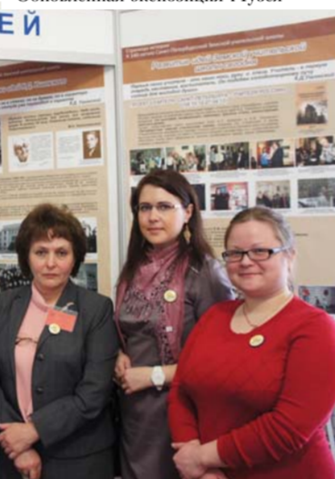
Сотрудники Музея и гости университетской выставки научных достижений

Музея – члены Творческого союза музейных работников Санкт-Петербурга и Ленинградской области.