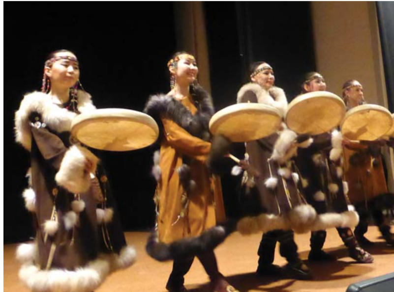
Выступление ансамбля «Северное сияние»

Исторический опыт сегодня, в ситуации нарастающего глобального экологического и глубоко связанного с ним духовного кризиса, заслуживает самого большого внимания. И дело не только в том, что сохранение и устойчивое развитие коренных малочисленных народов является важнейшим условием устойчивого развития арктических и северных регионов России, обладающих огромными, имеющими для страны приоритетный смысл, стратегическими природно-сырьевыми ресурсами. Речь идёт и о сохранении важнейшей особенности уникальной российской цивилизации – её поликультурности, полиэтничности. Следует подчеркнуть, что сохранение, вопреки нарастающим глобализационным процессам, культурного и языкового многообразия человечества является не просто некой гуманитарной, факкультативной по характеру задачей. Это – необходимое условие физического выживания человечества. Культурное многообразие здесь – одна из фундаментальных основ жизни,